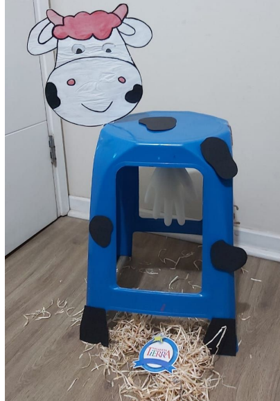
Paso 6: A ordeñar la vaca.